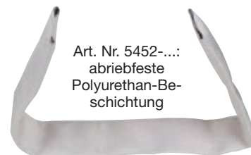
Art. Nr. 5452-...: abriebfeste Polyurethan-Beschichtung