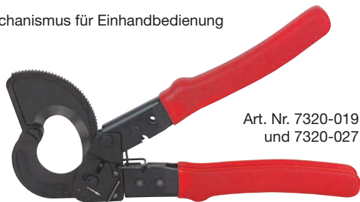
Art. Nr. 7320-019 und 7320-027