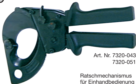
Art. Nr. 7320-043 7320-051